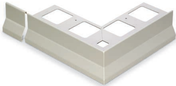
Esempio di raccordo e giunzione